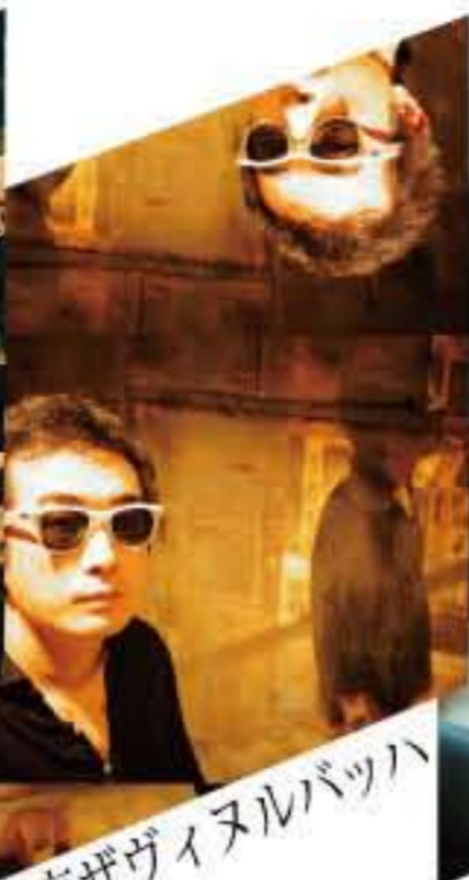
東京ザヴィヌルバッハ