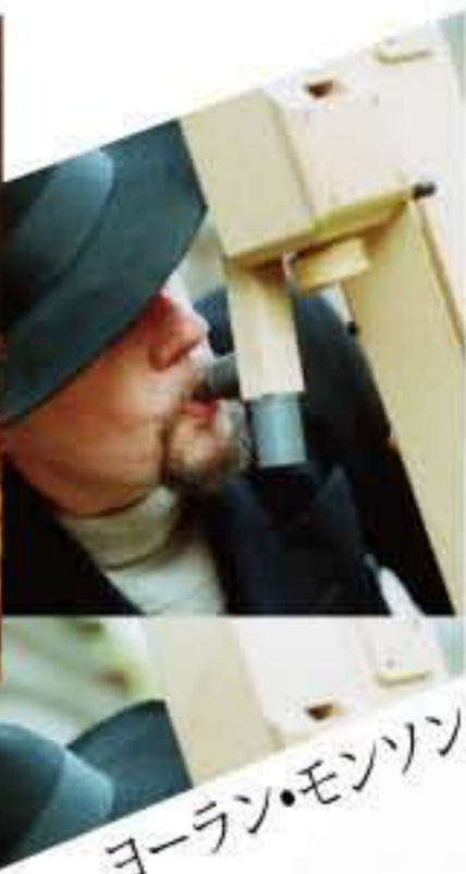
ヨーラン・モンソン