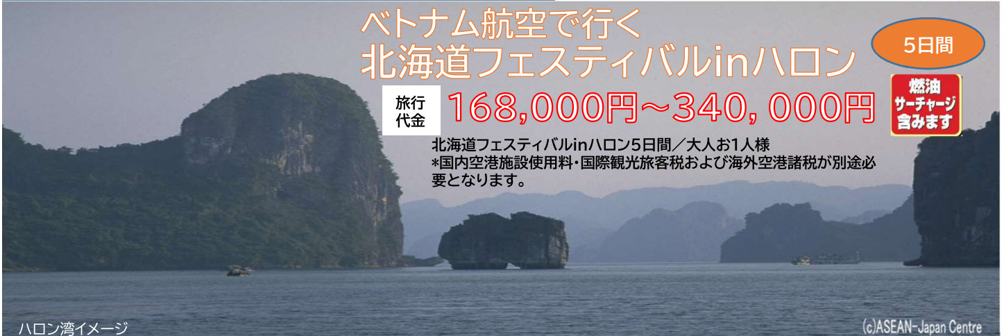
ハロン湾イメージ

北海道フェスティバルinハロン5日間/大人お1名様 *国内空港施設使用料・国際観光旅客税および海外空港諸税が別途必要となります。